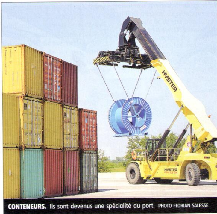
CONTENEURS. Ils sont devenus une spécialité du port.

Chargés à Gron, conteneurs et colis lourds (50 tonnes) prennent