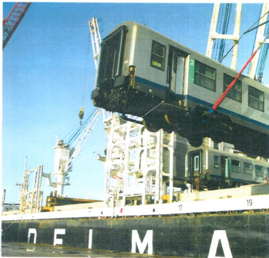
PORT DU HAVRE